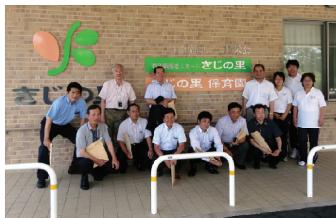
▲7/18～7/19 平成24年 厚生委員会県内視察