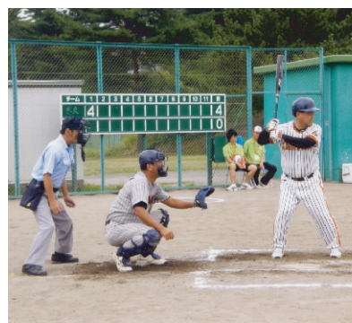
対奈良県議団戦 コールド勝ち

復興がんばろう東北 県議会議員親善野球大会 8月24日(金)～26日(日)まで全国県議会議員野球大会が32チーム参加で仙台市で行なわれました。静岡県議団3年ぶりの参加であります。尚他県との交流は野球全国大会の他、ゴルフ東海4・7県大会があります。私は1期生の時から参加しており、今では他県の先生方と懇親が出来る程知り合いの県議が沢山おります。私は野球もゴルフも嫌いではありませんが、この目的は議員交流であります。我党では、議員野球に加入していない人は議長になれないという約束もあつた様に聞いておりますが、最近私より期数の上の方は応援にも来ず他県との比較でベンチの人数の違いはさびしい限りであります。