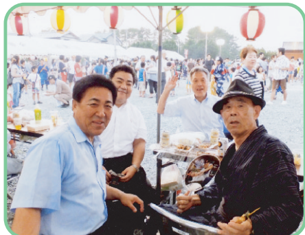
▲7/28 初生町納涼祭 旧企業局跡地に

9月定例議会は、中部電力浜岡原子力発電所の再稼働の是非を問う県民投票条例が大ききウェイトをしめています。しかし、9月補正予算で災害対策や国庫関連事業の実施等に加え、東日本大震災の復興モデルとなる災害に強い地域づくりに必要な経費について計上しました。補正予算の規模は、149億7千4百万円であり、原発の条例についてお話ししますと、会派代表と私、副代表が9/5(水)