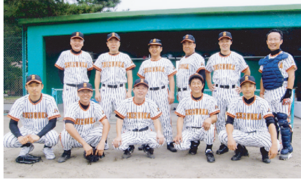
▲静岡県議団チームの面々

す。しかしながら、1期2期生が野球大会に出たいと言えば、座骨神経痛なんのそのであります。4ブロックに分けて、4チーム優勝という形式であります。3つ勝てばブロック優勝であります。結果は、2回戦さよなら負けでした。静岡県議団の夏は終わりました。相手チーム30名程、我がチーム10名という差ができました。来年は議員交流目的の議員野球20名は連れて参加したいと責任者として考えております。それと我がチームのピッチャー、私が見た所、他県にはいない様な本格派の大学出ピッチャーであります。密かにここ1・2年で全国制覇を考えています。まずは彼の球を受けるキャッチャー作りであります。座骨神経痛治します!!