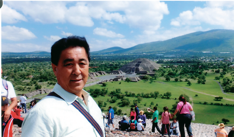
▲6/1 メキシコシティー テオティワンカ 世界遺産調査