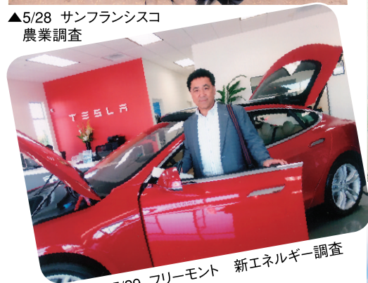
▲5/29 フリーモント 新エネルギー調査