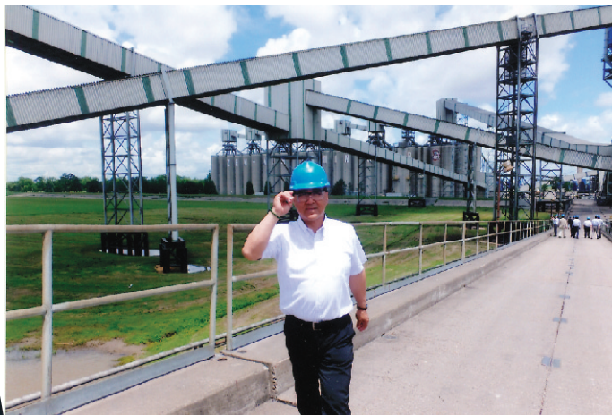
▲6/3 ニューオリンズ 全農グレイン社調査